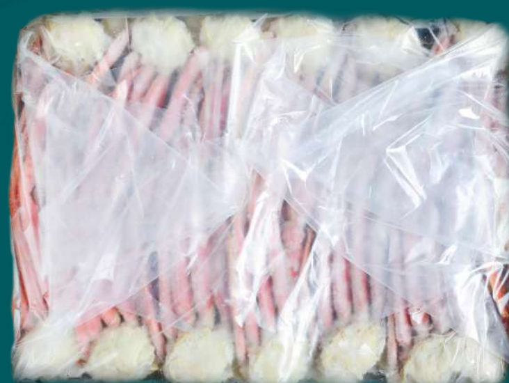
奥皮利奥雪蟹打包中